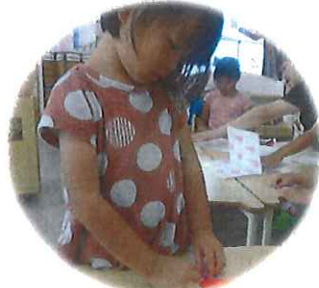
とても集中しています😊