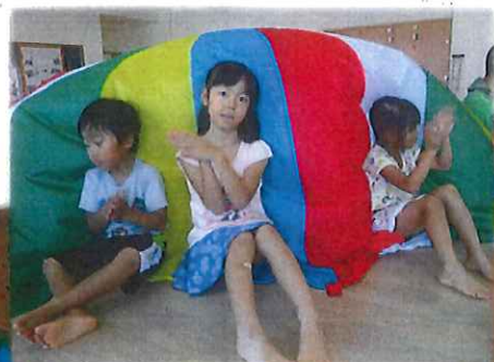
上手くはらんだね♥