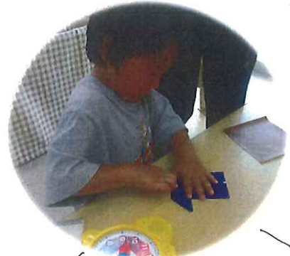
しっかり手でアイロンがけしないと ダメなんです〜