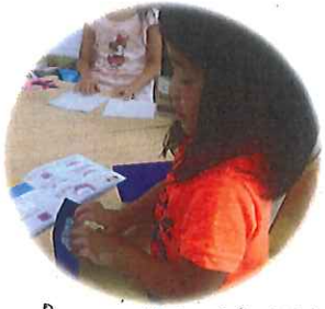
作ってピアノで先生みたいに... ドレミソラシドが