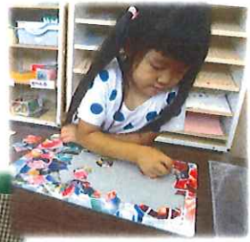
しまし組さん1人でも 完成できます😊