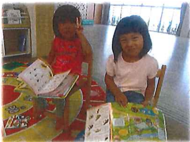
写真とことごとく ハイチーズ😊