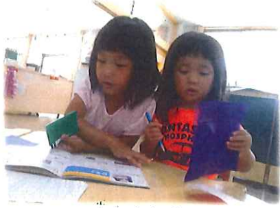
次はイロ作ってあげよう??