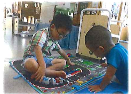
今、信号赤だからとまらなさい!!