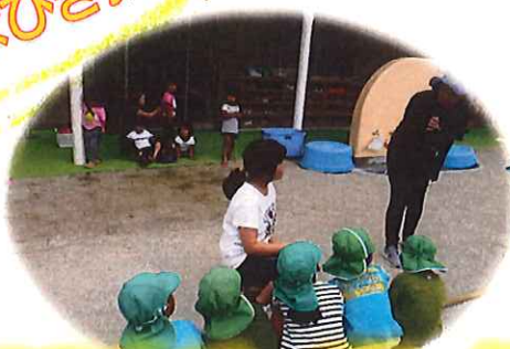
みんなー!! 準備は いいかなー??