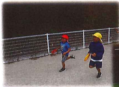
バドミントンも上手になりました☆