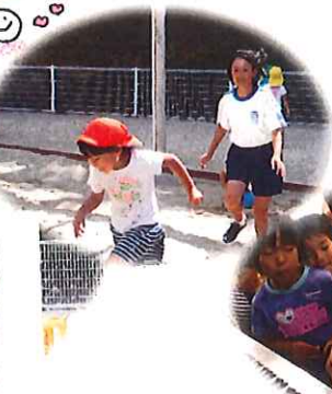
昨日のおやつ の時間に教えて もらいました。