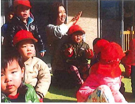
応援してくれました。