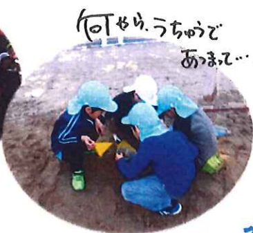
何やらうちゅう あまて...