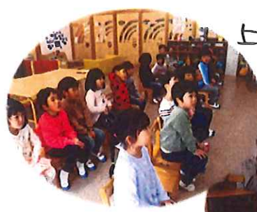
上手～!! がいぼってます。