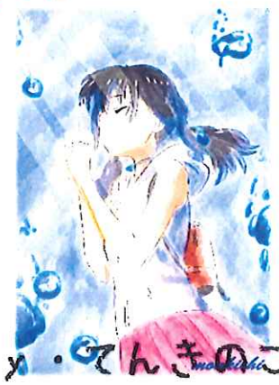
b y . てんきのこ