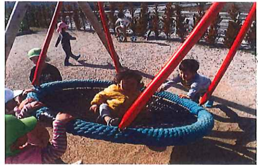
赤ちゃんのってるから、 高なおちばい!!