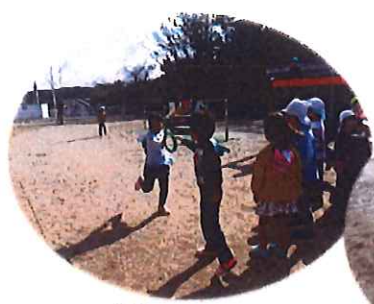
久しぶりに リレー!! 先生にじゃんまわして まいてこ

今日は、雨かな～なんて心配してましたが、いいお天気になり外で遊ぶことが出来ました。そのあとは部屋に入って卒園式の証書もらうやり方を、園長先生に教えてもらいました。初めてでドキドキ!!ちょっと難しんだけど、よ～く見ていてみんな上手!園長先生にもほめてもらって嬉しそうでした。卒園までなんだかあ～という間ですね。明日は楽しみに楽しみにしていた、お別れ遠足!8時半までに来てよ～おにぎり弁当だよ～と話してます!!