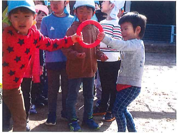
お兄ちゃんにバトンタッチ