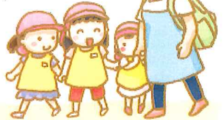
晴れたら海入りしたいなあ〜