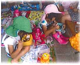
弁当は 玄米で飯と食べたい!