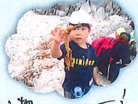
色んな物 見つけに楽しかったー!