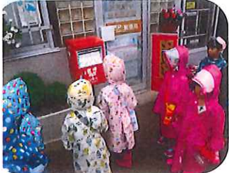
ポスト お 自販機見物