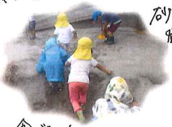
石の 遊びの大変さ