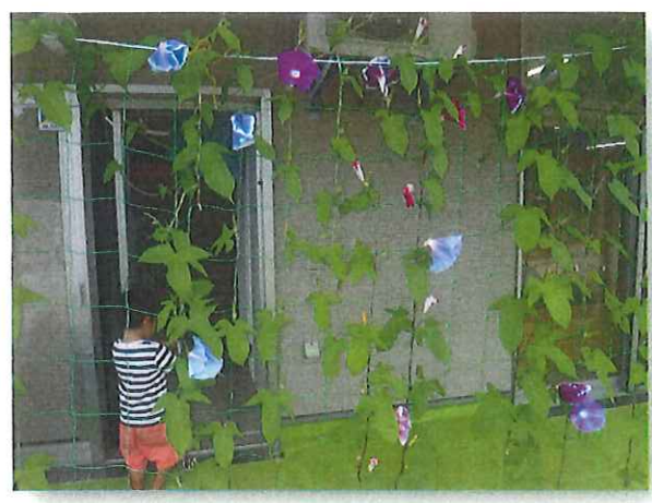
今が咲き頃「アサギ」キレイですね