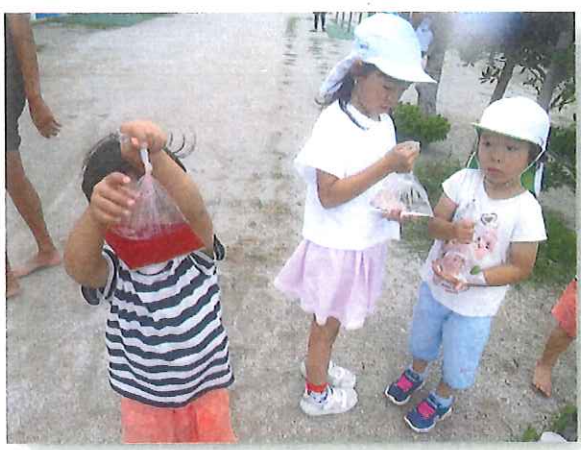
入れた花びらの色によって、水の色変わるんだよ！！