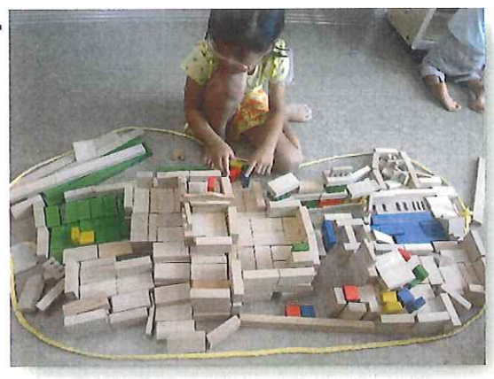
プール・水あそびの後は室内でゆたくとあそんでいる子どもたち。