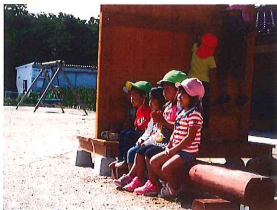
ほくもやっこめたいばあ... うちゅうぐみさんのバルーンは 興味津々です...