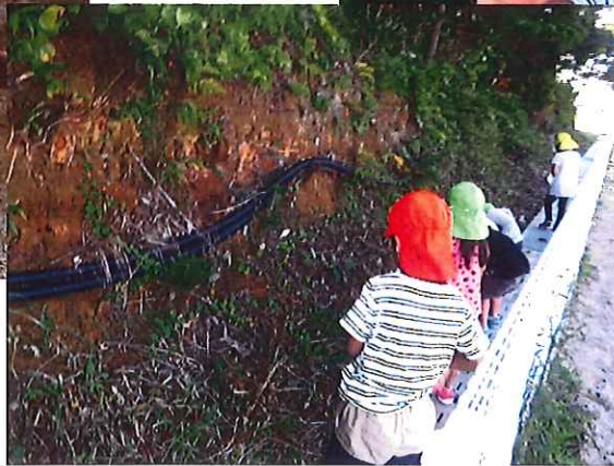
何人かのお友だちは フタの外にいき 探りにいきました。