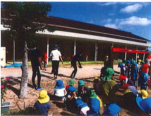
走。た。あ。と。も め。ん。な。い。た。様 ☐