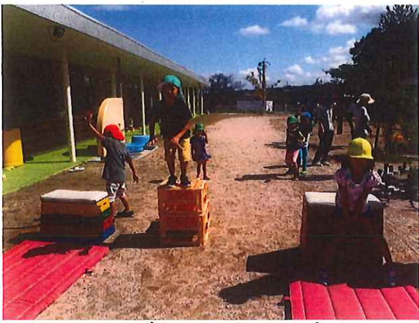
お遊戯の中はうんちやいのねんいう!!