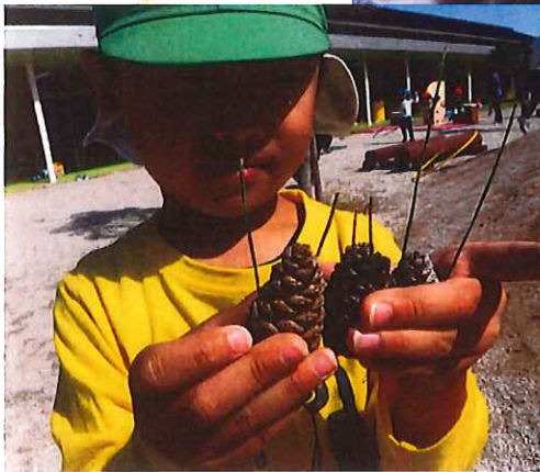
松ぼりのりどつかに うやぎさん