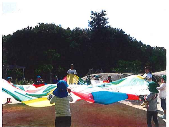
い。つ。も。ね。ん。し。や。を。頑。張。っ。て。い。る。う。ち。や。う。ぐ。み。さ。ん バ。ル。ー。ン。も。キ。レ。い。に。き。く。は。ま。せ。て。い。ま。す