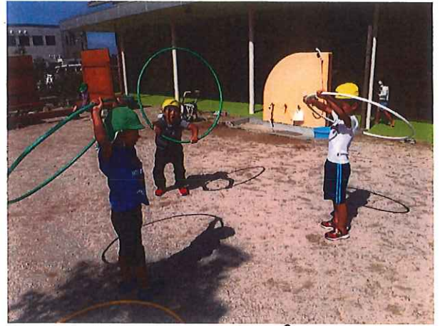
アアアアア (お遊戯してあげて)