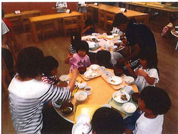
今日の給食は 座卓の机をぐるぐると食べましょ!!